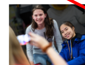
Køb din billet i dag